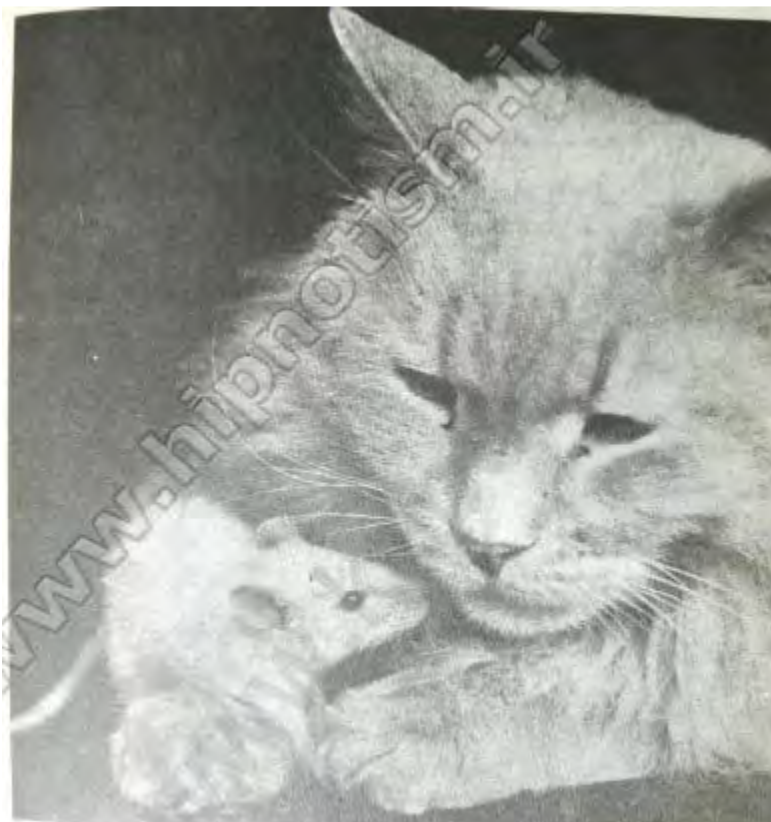
شکل ۴- موش و گربه بوسیله قانون پاولف از تربیت شده‌اند که باعث می‌شود آنها به راحتی با هم سازگار شوند.

دکتر (ش.ک) تعریف می‌کند: دختر کوچک من گربه ای داشت، فکر کردم چطور می‌توانم به کمک قانون پاولف به این گربه یاد بدهم که فقط از ظرف خودش برای غذا خوردن استفاده کند، پس از چند دقیقه فکر موضوع روشن شد و به این ترتیب عمل