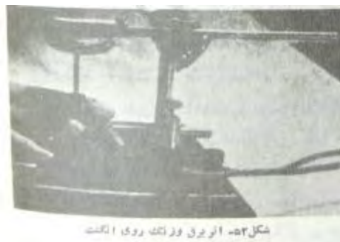
شکل ۵۲- اثر برق وزنگ روی انگشت

«ولادیمیر» به آزمایش‌شونده گفت که دست خود را روی دستگاه بگذارد چندین مرتبه ضربه الکتریکی توأم با صدای زنگ به انگشت آزمایش‌شونده وارد می‌شد، آزمایش‌شونده دست خود را به ناگاه و بی اراده می‌کشید، و هر مرتبه ضربه الکتریکی وارده همراه با صدای زنگ بود، پس از چندین مرتبه «ولادیمیر بکتریف» فقط زنگ را به صدا در آورد بدون این که جریان برق را وصل کند، نتیجه این شد که آزمایش‌شونده فقط به محض شنیدن صدای زنگ بدون اراده و اختیار دست خود را می‌کشید.