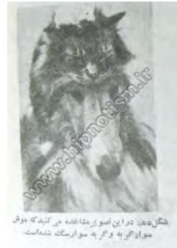
شکل‌ها: در این تصویر مشاهده می‌کنید که موش سوار گربه به و گربه سوار سگ شده‌است.

سگ دشمن گربه و گربه دشمن موش است، هر وقت سگی گربه ای را می‌بیند دندان‌هایش را تیز می‌کند، و می‌خواهد گربه را بخورد و گربه با دیدن موش به دلش صابون می‌زند و هواي بلعیدن او را دارد ولی این سگ، این (سایت هیپنوتیسم دات آی آر) گربه و این موش که شما آن‌ها را در عکس می‌بینید دوستان بسیار صمیمی هستند و با یکدیگر بازی می‌کنند و به فکر بلعیدن یکدیگر هم نیستند، گربه سوار بر سگ می‌شود و موش که نمی‌خواهد جای نرم را از دست بدهد سوار گربه می‌شود و آن‌ها عجیب‌ترین دوستی را به تماشا می‌گذارند.