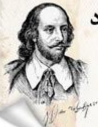
شکسپیر (۱۵۶۴-۱۶۱۶) (شاعر و نمایشنامه‌نویس انگلیسی)

گوش‌هایت را به همه بسیار اما صدایت را به عده‌ای معدود