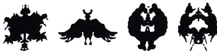
شکل ۲-۲. لکه‌های جوهر رورشاخ

دیگری است که حاوی مجموعه‌ای از تصاویر مبهم است. در این آزمون از درمان‌جو خواسته می‌شود تا در مورد آنچه در هر تصویر اتفاق می‌افتد، داستانی بسازد.