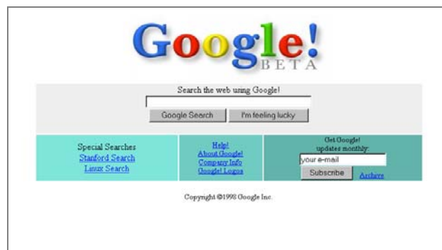
شکل ۱: اولین صفحه گوگل در سال ۱۹۹۸

گوگل با یک پروژه تحقیقاتی آغاز شد؛ پروژه تحقیقاتی لاری پیج ۲ ۲۲ ساله، دانشجوی دکترای کامپیوتر که در دانشگاه استنفورد تحصیل می کرد. آشنایی او در سال ۱۹۹۵ با سرگی برین ۳ ۲۱ ساله، دانشجوی دیگر استنفورد باعث شد که با کار با سرعت بیش تری به پیش برود. آن‌ها معتقد بودند که موتور جستجویی که قادر باشد روابط بین وب سایت‌ها را تجزیه و تحلیل کند و فهرست نتایج به دست آمده را براساس میزان اهمیت رتبه‌بندی کند بسیار بهتر از روش جاری جستجو در آن زمان خواهد بود. در سال ۱۹۹۶ نام موتور جستجو خود را Rub Back انتخاب کردند، زیرا سیستم طراحی شده به گونه‌ای بود که پیوندهای پس پرده را برای تشخیص اهمیت و منزلت سایت مورد بررسی قرار می داد. این موتور جستجو با آدرس google.stanford.edu کار خود را بر روی سرورهای دانشگاه آغاز کرد. نهایتاً در سال ۱۹۹۸ میلادی، آقایان لاری پیج و سرگی برین شرکت گوگل را ثبت و سایت را رسماً افتتاح کردند. (Google, 2011a)