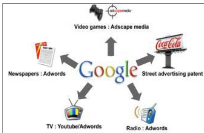
شکل ۳: مدل توسعه گوگل در بازارهای آفلاین

با همین دیدگاه گوگل خدمات تبلیغاتی خود را توسط داده و تبلیغاتی که به آن سپرده می‌شود، می‌تواند علاوه بر اینترنت در محیط‌های ذیل نیز پخش شوند: