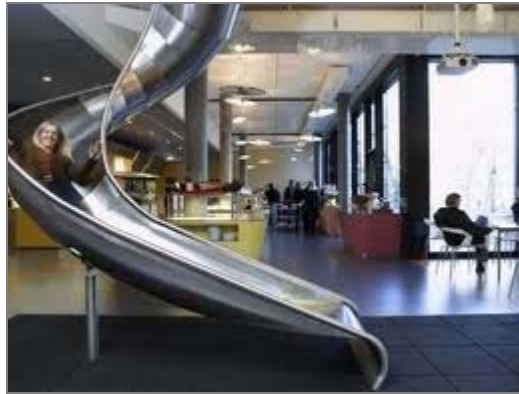
شکل ۴: یکی از دفاتر شرکت گوگل

بیش از ۲۰ هزار نفر کارکنان گوگل، در ۴۰ کشور جهان مشغول به کار هستند. گرچه گوگل به دلیل پرداخت حقوق کمتر از استانداردهای صنعت خود، مورد انتقاد واقع شده است، اما توجه همه جانبه به منابع انسانی، محیط کاری با نشاطی برای کارکنان فراهم آورده است. در شرکت همه چیز، اعم از وسایل کار، غذاخوری، سالن ورزش، شستشوی ماشین، خشک شویی و... را برای کارکنان فراهم است تا آنها فقط به کار خود پردازند. درصد وقت مهندسان گوگل به پروژه های شخصی و دلخواه آنها اختصاص دارد. یک صندوق پیشنهادهای مجازی نیز وجود دارد که فهرست ایده ها را در برمی گیرد. این فهرست به طور مرتب با پست الکترونیکی بین کارکنان رد و بدل می شود و آنها درباره این ایده ها به آنها امتیاز می دهند و بدین ترتیب بهترین ایده ها به صدر می آیند. آخر هفته کاری، گردهمایی همگانی در گوگل برقرار است که مسائل اعلام اطلاعیه ها، معرفی اعضای جدید، پرسش و پاسخ و نیز خوردن و نوشیدن است و تمامی مدیران و کارکنان در آن شرکت می کنند. گوگل نمی گوید به کارمند وفادار باید اعتماد کرد بلکه بر این باور است که کارمندی که مورد اعتماد قرار گیرد وفادار هم خواهد بود. (بینش، ۱۳۸۷)