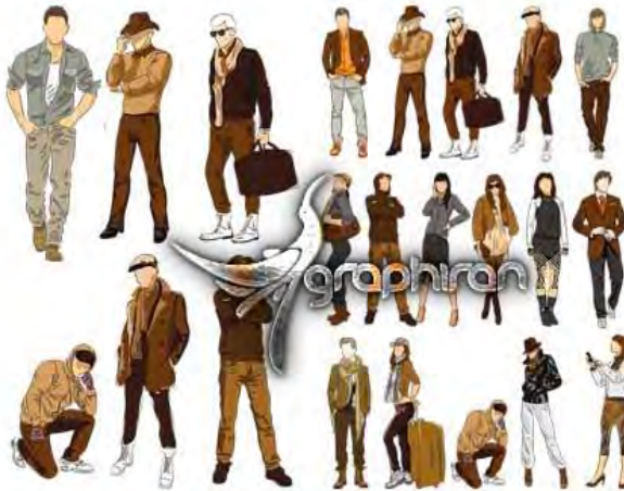
Autumn Style and Fashion Vector (EPS) www.graphiran.com

می توانید به جای این که بنویسید انواع مدل ها را دارید از انواع مدل های خود عکس بگیرید و تبلیغ کنید. مانند نمونه زیر: