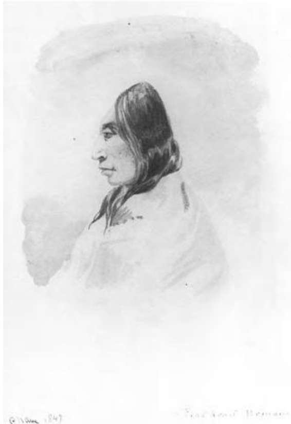
Field sketch by Paul Kane [5]

چندتایی از قبایل بومی آمریکا، که ساکن جلگه‌های بالایی بودند، زیبایی را در این می‌دیدند که تخته چوب کوچکی را در بخش جلویی سر نوزادان که هنوز در حال رشد است قرار دهند. [۴] همانطور که بچه بزرگتر می‌شد، این تخته‌ها در حالت کشیده‌تری قرار می‌گرفت. همانطور که متخصص ارتدونسی به تدریج دندان‌ها را هم‌ردیف می‌کند. معلوم نیست که مغز در نتیجه‌ی این عمل صدمه می‌دیده است یا نه، اما این تغییر باعث می‌شده است تا سر، حالتی مخروطی و