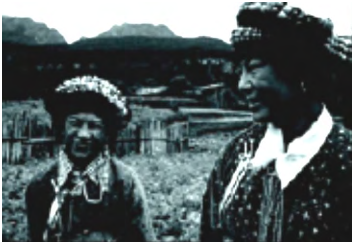
زنان موسویی

به ویژه، موسویی‌هایی که بیش از سایرین پرشور و حرارت هستند، بدون هیچ گونه احساسِ شرم از صدها تجربه‌ی جنسیِ خود سخن می‌گویند. شرم - از نگاهِ ایشان - شایسته‌ی موقعیت‌هایی است که کسی از دیگری درخواستِ وفاداری و تعهد می‌کند. درخواستِ وفاداری و تعهد، به عنوان عملی ناشایست و تلاشی برای معامله یا معاوضه نگریسته می‌شود.