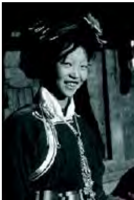
زن موسویی

حیاطِ داخلیِ خانه راه دارد و هم از طریقِ یک درِ خصوصی به کوچه. دخترِ موسویی در مورد اینکه چه کسی از طریقِ درِ خصوصی واردِ «باباهواگو» ۱ یا (اتاقِ گل) او شود از خودمختاریِ کامل برخوردار است. تنها قانونِ سرسختانه این است که مهمان او باید قبل از طلوعِ آفتاب از آنجا بیرون رفته باشد. دختر اجازه دارد در صورتِ تمایل، در شبِ بعد- یا در همان شب- معشوقِ متفاوتی داشته باشد و هیچ انتظاری برای تعهد وجود ندارد. هر بچه‌ای که در این بین به وجود آید، در خانه‌ی مادرِ این دختر بزرگ می‌شود، و در این دوران، برادرانِ دختر و سایر اعضای خانواده به دختر کمک می‌کنند.