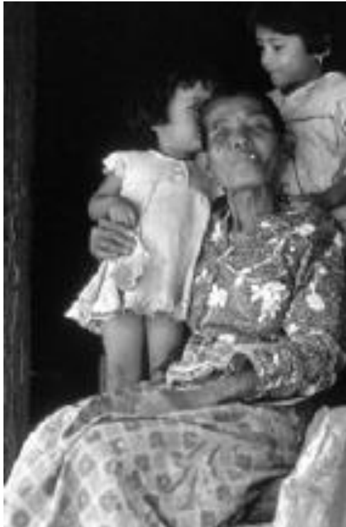
زنی از مینانگ کاباو به همراه دو دختر

نه رقیبانی که به دنبال منافع شخصی خودمحورانه هستند." و اینکه همانند گروه‌های اجتماعی بونوبوها، جایگاه زنان، با پا به سن گذاشتن و یا "ایجاد روابط مطلوب با دیگران افزایش می‌یابد. . . ." [۱۶]