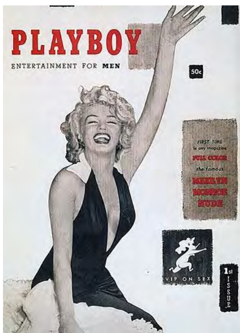
نخستین شماره مجله «پلی‌بوی» دسامبر ۱۹۵۳

چنین نگاهی به سرشت میل جنسی انسان از هر چیزی سخن می‌گوید جز گزارش‌های مربوط به